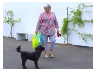
Portraits de bénévoles... cliquez !