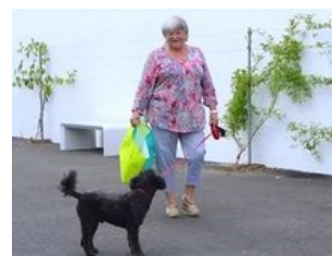
Portraits de bénévoles... cliquez !